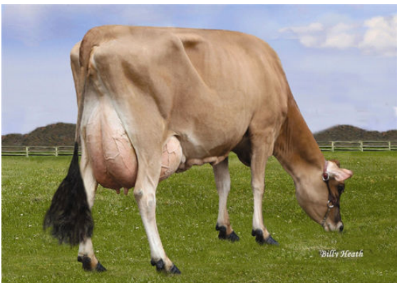
LUCKY HILL JOKER WABORITA FOURTH DAM